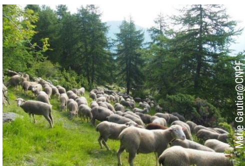
Troupeau dans le mélèzin

Nous pourrons nous regrouper dans les voitures les plus adaptées aux pistes forestières.