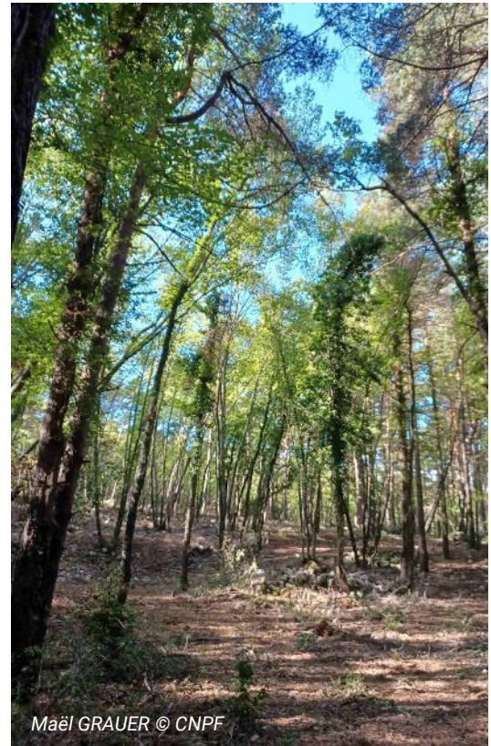
Maël GRAUER © CNPF

Cette journée sera l'occasion de présenter les actions que vous pouvez mettre en œuvre en tant que propriétaire forestier en s'appuyant sur des cas concrets de différents essais menés sur les forêts du domaine des Courmettes.